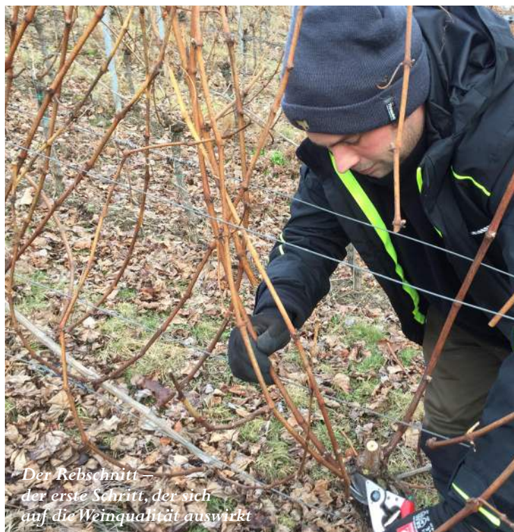
Der Rebschnitt – der erste Schritt, der sich auf die Weinqualität auswirkt