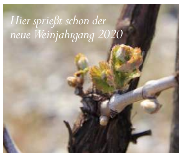
Hier sprießt schon der neue Weinjahrgang 2020