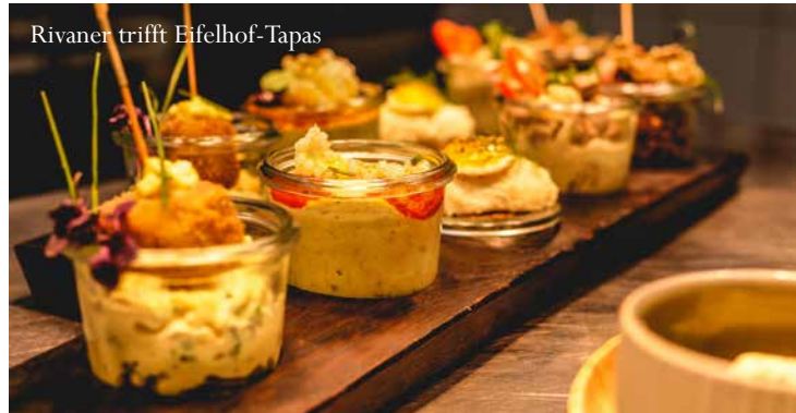
Rivaner trifft Eifelhof-Tapas

Die entsprechenden Weine, für die es digitale Weinproben gibt, sind mit einem kleinen Zapcode auf der Weinliste (siehe Rückseite) gekennzeichnet.