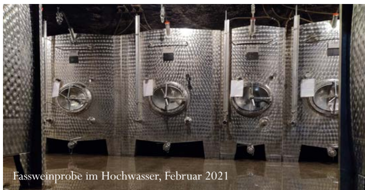
Fassweinprobe im Hochwasser, Februar 2021