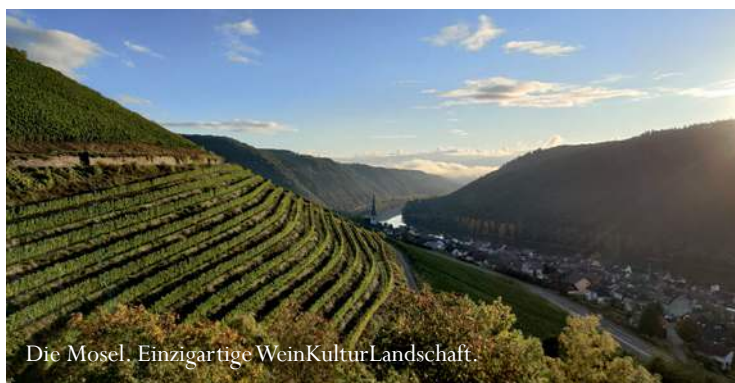
Die Mosel. Einzigartige WeinKulturLandschaft.