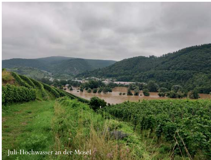
Juli-Hochwasser an der Mosel

ES IST MIR EGAL, OB MIR JEMAND EIN GLAS WASSER REICHEN KANN. ICH WILL EIN GLAS WEIN!